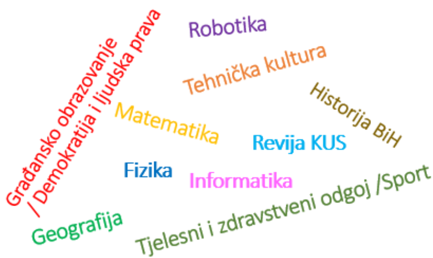
Shematski prikaz nastavnih predmeta/oblasti