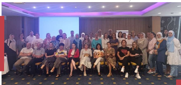
Stručno usavršavanje za nastavnike matematike