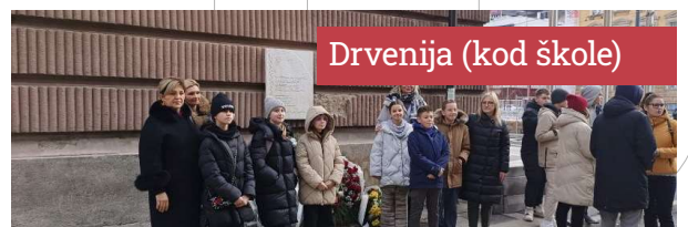
Drvenija (kod škole)