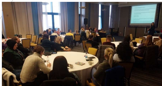
Stručno usavršavanje za stručne saradnike u sastavu Mobilnog stručnog tima za podršku inkluzivnom obrazovanju u Kantonu Sarajevo