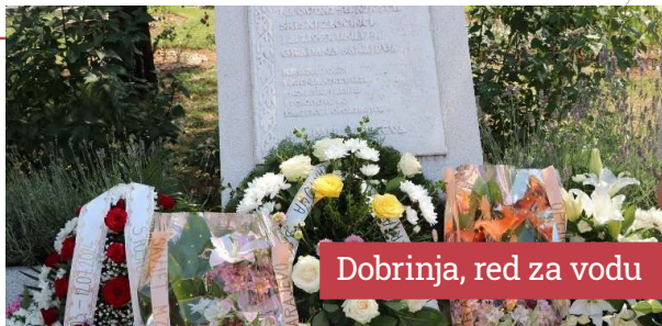
Dobrinja, red za vodu