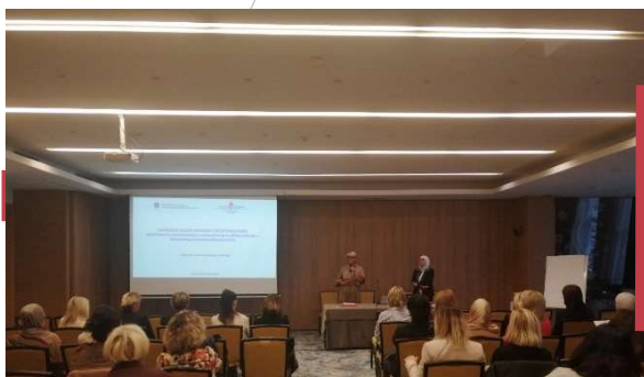
Stručno usavršavanje za pedagoge osnovnih i srednjih škola Kantona Sarajevo