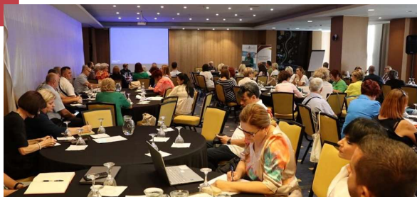
Stručno usavršavanje za direktore