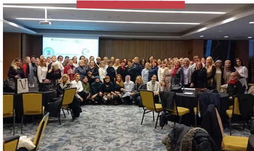
Stručno usavršavanje za nastavnike koji izvode razrednu nastavu u osnovnim školama Kantona Sarajevo