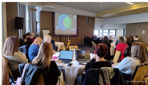
Stručno usavršavanje za nastavnike predmetne nastave osnovnih škola Kantona Sarajevo