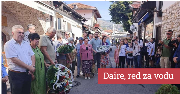
Daire, red za vodu